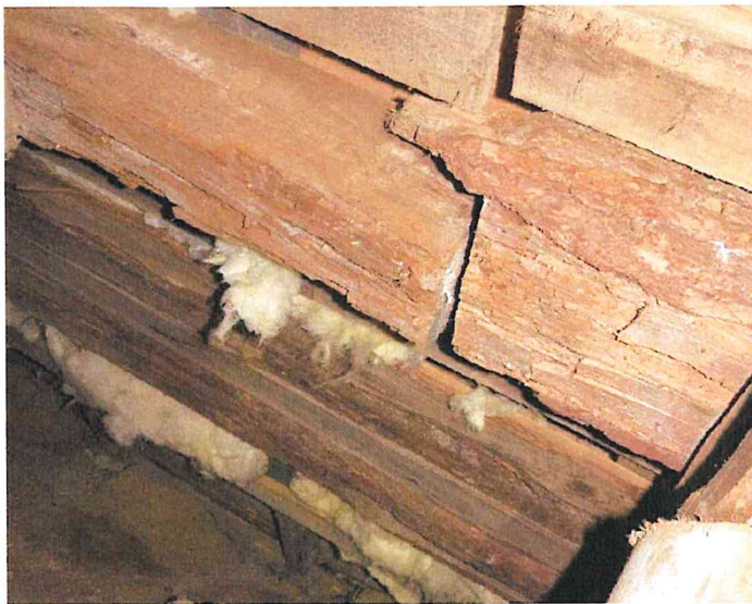
Rötskadad bärande balk