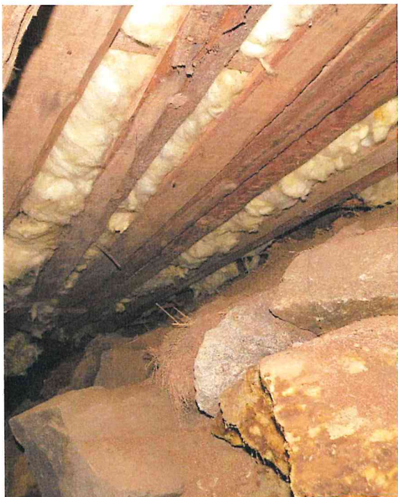
Lågt utrymme mot yttervägg

Generell bild av kryprummet under orgeldelen ovan